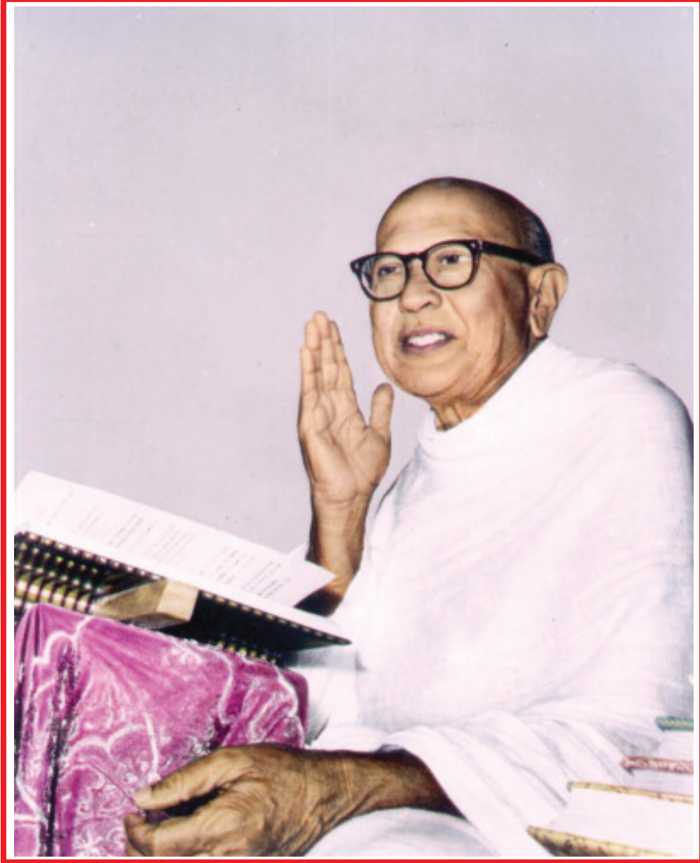
अध्यात्मयुगसर्जक पूज्य गुरुदेवश्री कानजीस्वामी